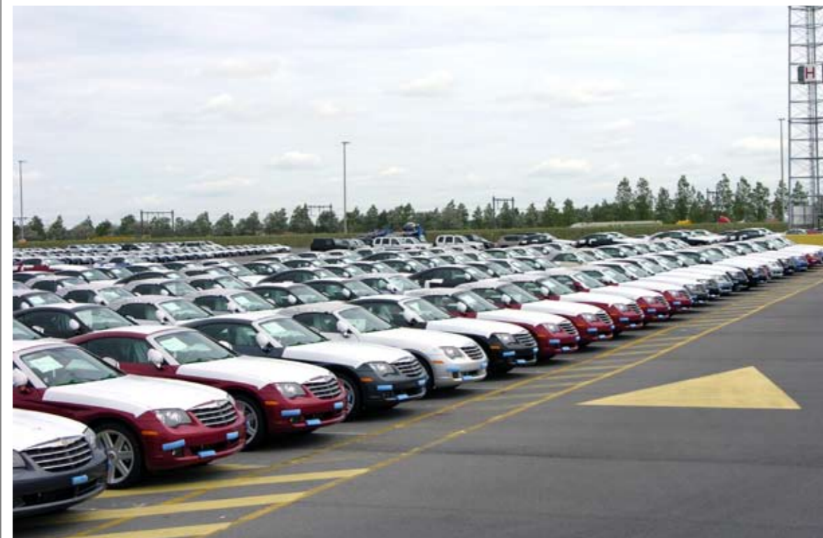
Dankzij de export naar de BRIC-landen zal de Europese autoproduktie de komende jaren nog verder groeien.