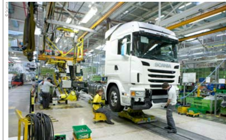
In Europa wordt de productie bij Scania met 10 tot 15% afgebouwd.

Omwille van de dalende vraag gaat Scania minder vrachtwagens produceren. Bij MAN wordt met een ploeg minder gewerkt, maar Daimler verwacht daarentegen een stijging van de vraag.