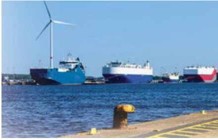
Nella foto: Navi porta-auto Grimaldi dell'ultima generazione.

BRUXELLES – ECG , l'Associazione europea della logistica dei veicoli, e Smart Freight Centre hanno pubblicato la prima metodologia armonizzata per la contabilizzazione delle emissioni di gas serra delle operazioni Ro-Ro, allineata agli standard internazionali esistenti in materia di contabilità delle emissioni di carbonio per il settore logistico, ovvero il Global Logistics Emissions Council (GLEC) Framework e la norma ISO 14083. La metodologia consentirà alle compagnie di navigazione di avere una guida di riferimento che supporterà loro e i produttori di automobili nel loro percorso di decarbonizzazione.