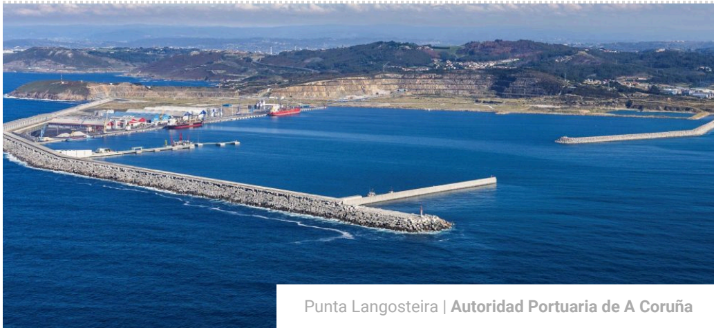
Punta Langosteira